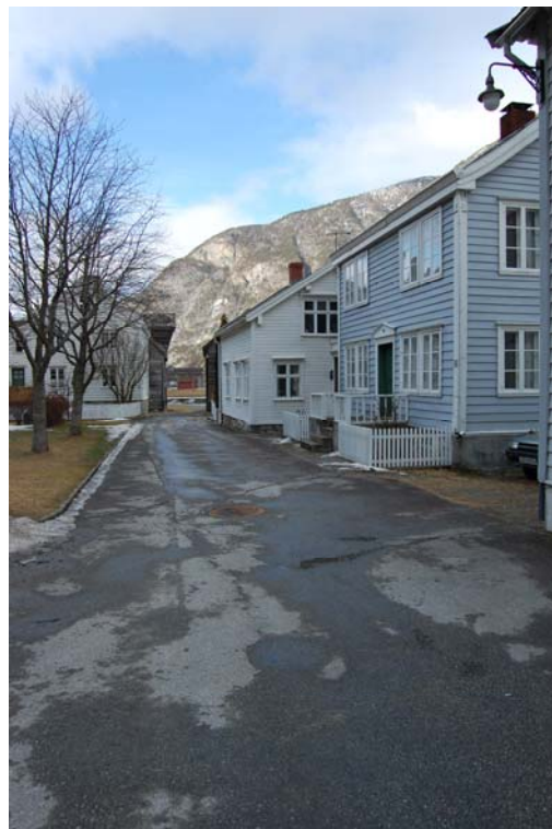
Bygningsmiljø langs Øyragata i verneområdet.