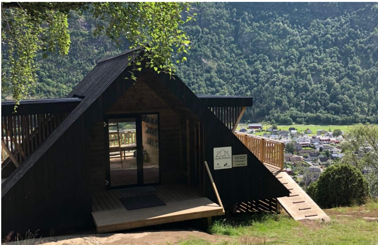
Dagsturhytta på Mjølkeflaten. Hytta vart opna i 2018.

Målsetjingane i kommunedelplanen frå førre periode samsvarar med målsetjingane for inneverande planperiode. Det er viktig for Lærdal kommune å sikre samarbeid om eit idretts- og aktivitetstilbod for alle i kommunen. Dette kan ein best realisere gjennom eit nært samarbeid mellom laga i kommunen og å involvera nabokommunane. Utfordringa er til ei kvar tid å finna fram til tiltak som mange, i dag lite fysisk aktive innbygarar, ynskjer og klarar å vera med på. Berre gjennom eit personleg ynskje og haldningar vil innbygarane ta i bruk anlegg og natur til idrett og fysisk aktivitet. Denne motiveringa må vera eit kontinuerleg arbeid, som må starte i barnehage- og skulealder.