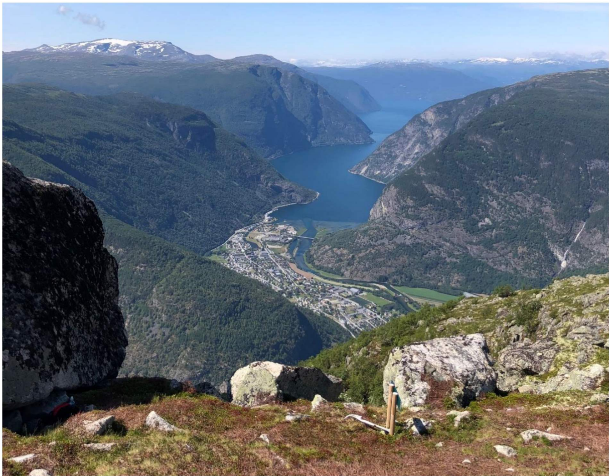
Torsteinen er eitt av fleire populære turmål i kommunen.

Kommuneplanen legg føringar for bruk av areal i kommunen. Samfunnsdelen legg føringar for kva Lærdal kommune skal arbeide med for å nå visjonen Grøne Lærdal. Herunder ligg korleis kommunen arbeidar for folkehelse og gode tilbod og tenester for innbyggjarane i kommunen.