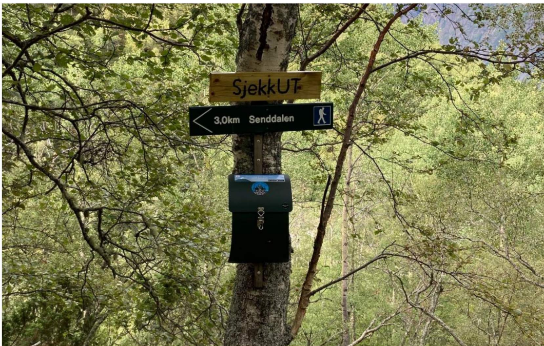
SjekkUT på Hit (Hitakvile) på veg mot Sendedalen. Turmålet er ein del av Lærdal Turlag sin bakketrim i 2020.

Mestringsressursane våre er samansett av mange faktorar, der både aktivitet, deltaking og engasjement er viktig. I folkehelsearbeidet er det dessutan viktig å motarbeide utvikling av sosiale helseskilnader i samfunnet, også lokalt. I den samanhengen er tilrettelegging for friluftsliv eit vesentleg verkemiddel. Friluftsliv set få krav til utstyr, det er rimeleg å drive med, det kan gjennomførast åleine eller ilag med, og det kan tilpassast fysisk form og alder. Eit døme på aktivitet er Lærdal og Aurland LHL sine onsdagsturar som skal vere eit lågterskeltilbod for dei som ynskjer å gå tur i variert terreng i grupper.