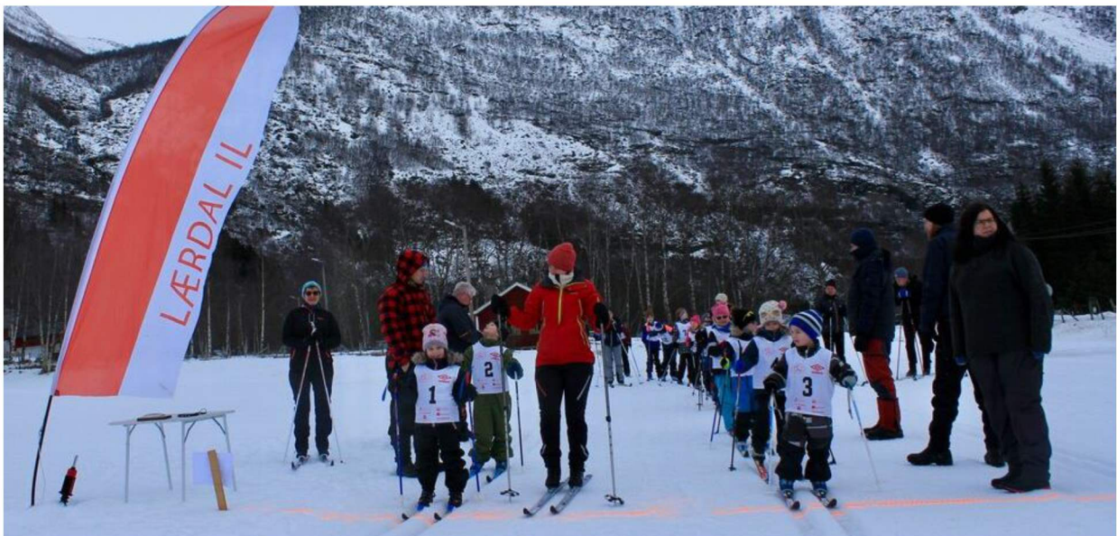
Cuprenn i skiløypa på Øvre Kvamme.

Folkehelse gjeld ikkje berre innanfor helsesektoren men er eit tverrgående tema. Helsefremmande tiltak som gjer at innbyggjarane sjølve tek større ansvar for eiga fysisk og psykisk helse, vil verka positivt både for den einskilde og for samfunnet. Eit eksempel på tiltak kan vere lett tilgang til turstiar og friluftsliv i nærområda der folk bur. Dette kan vere for å få folk meir ut. Det same gjeld innandørs tilbod i dei ulike gymsalane i kommunen. Ved å ha tilbod i kort avstand frå heimen, vil fleire prioritere å bruke det. Her er det også aktuelt å koble seg på prosjektet Leve heile livet 2020-2022 som vert halde i regi av Fylkesmannen i Vestland.