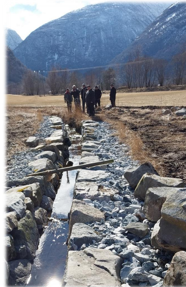
Samarbeidsgruppa på synfaring på Hauge.

Det kan betalast ut tilskot etter kvart som deler av tiltaket vert utført, på bakgrunn av godkjent dokumentasjon. Minst 25 % av tilskotet skal haldast attende til arbeidet er fullført og arbeidet og sluttregneskapen er godkjent.